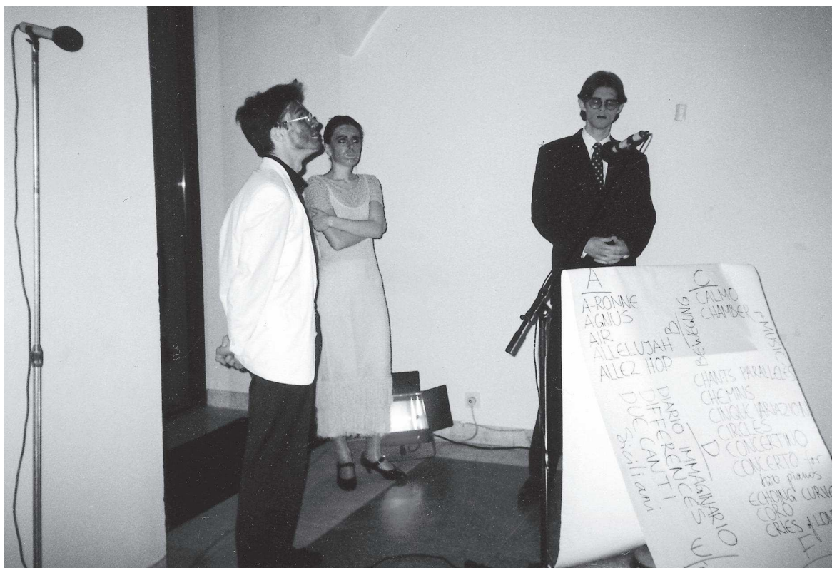
TUMP 1996 avamine Rütüti galeriis. H. Elleri nim Muusikakooli õpilased esitamas Luciano Berio teoste pealkirjadest inspireeritud „kõnekoori“. Näod on värvitud Itaalia lipu värvides.